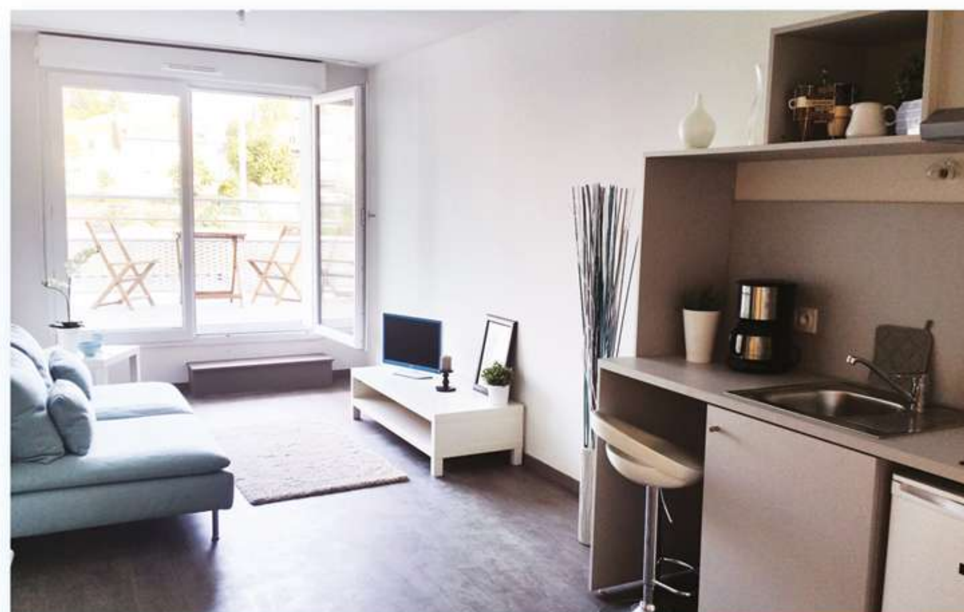
Image de logement sénior non contractuelle