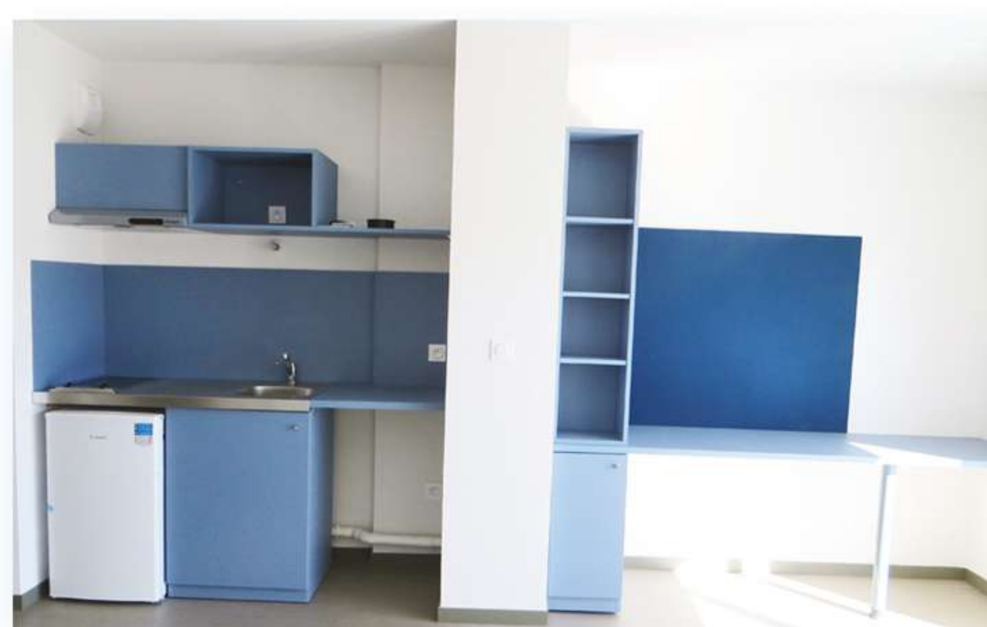
Image de logement jeune non contractuelle

Un gardien est logé sur place et en partenariat avec le CCAS de Vichy, une équipe dédiée propose des services d'accompagnement et d'animation.